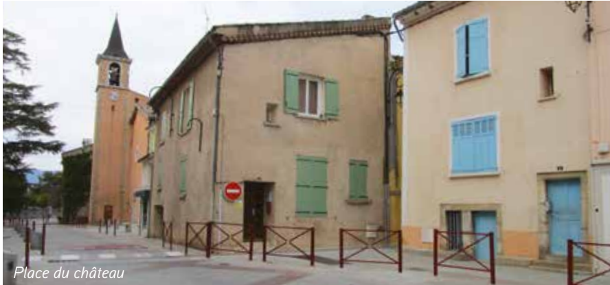
Place du château

dangereux) et devant l'église, à créer 2 ralentisseurs et 4 places de parking. Le tout a été réalisé par l'entreprise Eiffage et a bénéficié de subventions départementales (amendes de police).