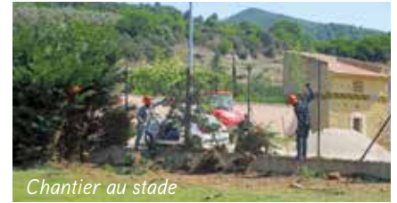
Chantier au stade

Une convention de partenariat entre la commune et le Centre de formation professionnelle et de promotion agricole (CFPPA) de Carmejane a été signée. Elle a pour but de permettre à ses apprenants d'obtenir des chantiers réels sur les espaces verts. La commune prend en charge l'achat des matériaux nécessaires selon les chantiers. Le premier d'entre eux a été effectué aux abords du stade Gombert et sous le château.