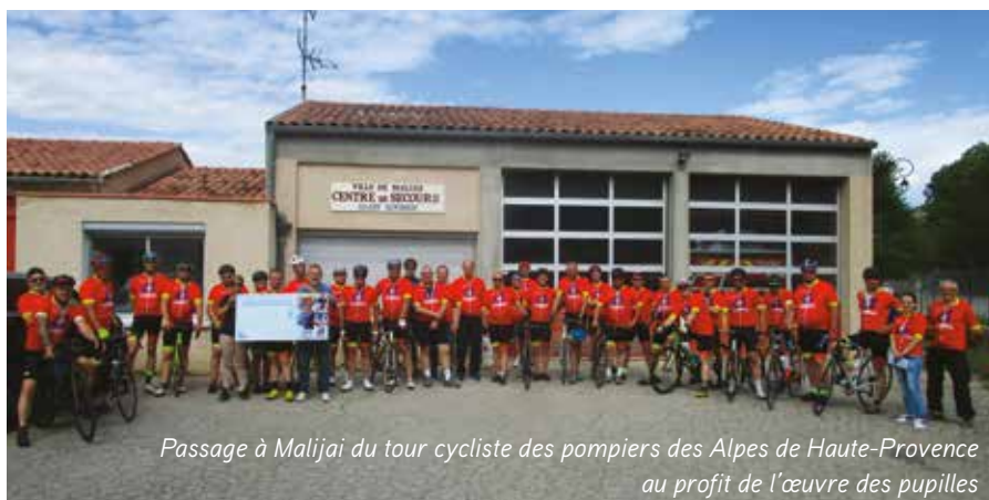
Passage à Malijai du tour cycliste des pompiers des Alpes de Haute-Provence au profit de l'œuvre des pupilles