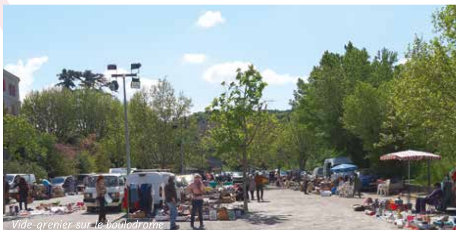
Vide-grenier sur le boulodrome