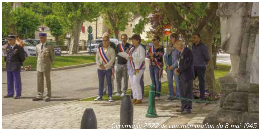
Cérémonie 2022 de commémoration du 8 mai-1945

Prenez soin de vous et de vos proches Bien chaleureusement