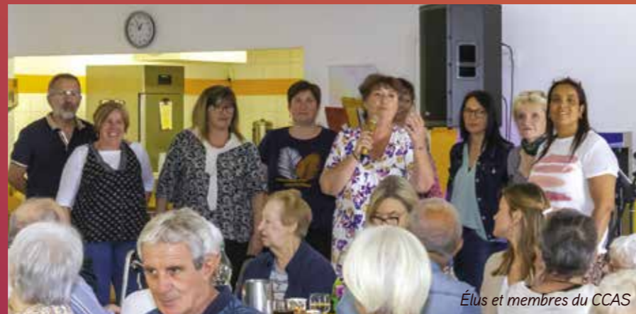
Élus et membres du CCAS

Toujours désireux de créer du lien social, le CCAS a invité autour d'un repas convivial tous les aînés de la commune de 65 ans et plus. Cette année au menu, c'était couscous préparé sur place par l'équipe de MNB traiteur, tandis que l'animation musicale était assurée par le groupe Melka qui a légèrement modifié son répertoire pour l'occasion. Environ 120 personnes ont répondu présentes et ont apprécié cette journée en la clôturant avec trois pas de danse.