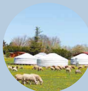
Séjour à la ferme

Début des inscriptions le mercredi 28 juin au Club jeunes