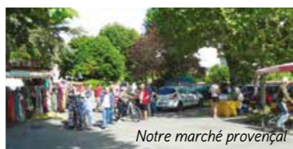
Notre marché provençal

à la vente des fruits, des légumes, des fromages, des vêtements, des plants et bien d'autres choses encore.