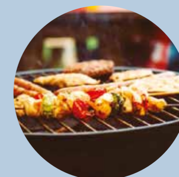
BBQ de fin de saison

Renseignements au Club jeunes Lundi de 18h à 19h Mercredi et samedi de 14h à 18h30