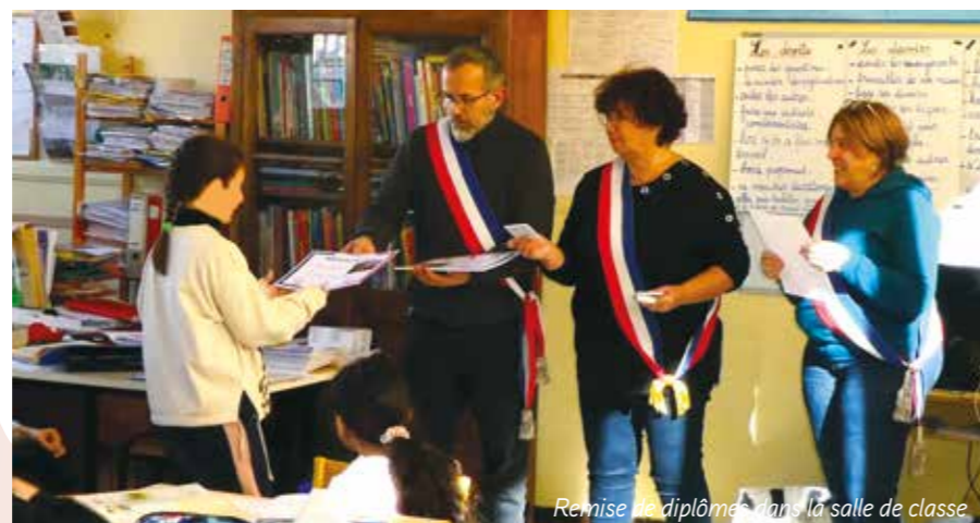
Remise de diplômes dans la salle de classe

Le 11 novembre dernier, les enfants des classes du CM1 et du CM2 ont participé à la cérémonie spéciale des 100 ans du monument aux morts en récitant des poèmes. La municipalité est venue les rencontrer dans leurs classes pour les féliciter, leur expliquer l'importance du devoir de mémoire. Un diplôme du petit citoyen leur a été remis individuellement (action du PEDT).