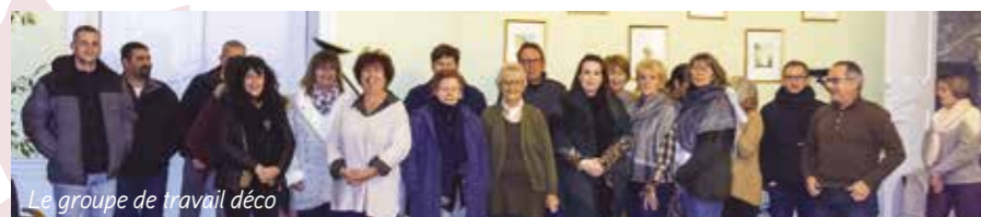
Le groupe de travail déco

sement et leurs superbes réalisations qui ont contribué à l'esprit de Noël.