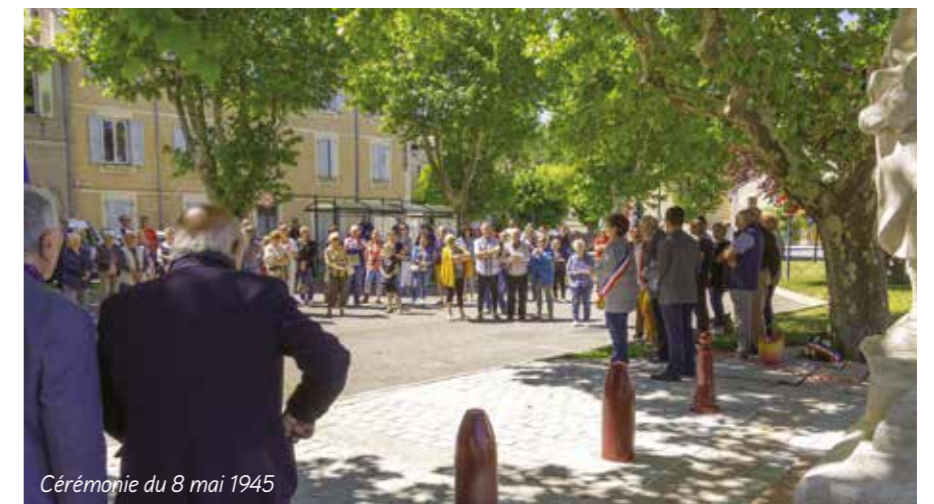
Cérémonie du 8 mai 1945