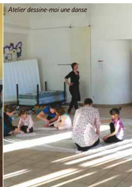
Atelier dessine-moi une danse