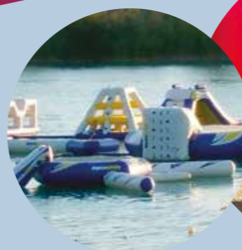
Aquagame et GellyBall Lac des Buissonnades