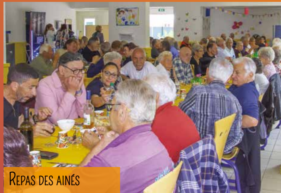
REPAS DES AINÉS

Les noms proposés portaient sur les arbres ou des lieux-dits de la commune. Des cartes comportant la dénomination de toutes les rues seront consultables durant tout l'été en mairie. Le changement éventuel d'adresse n'entraînera pas de frais auprès des administrations. Des informations complémentaires vous seront fournies en dernière phase du plan début 2024.