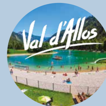
Base de loisirs d'Allos