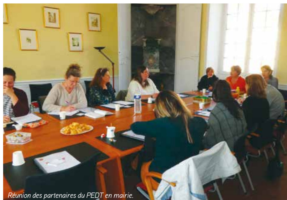
Réunion des partenaires du PEDT en mairie.

et de formations pour favoriser une montée en compétence des agents et mettre à leur disposition des outils dans leurs missions et de contribuer à la compréhension des comportements des enfants et des enfants en situation d'handicap. Le passage du temps méridien en temps pédagogique a permis de favoriser un accueil de qualité contribuant au bien-être des enfants. À cela, s'ajoutent des actions sur la parentalité, le jardin pédagogique... Un grand merci à tous les acteurs pour leur implication !