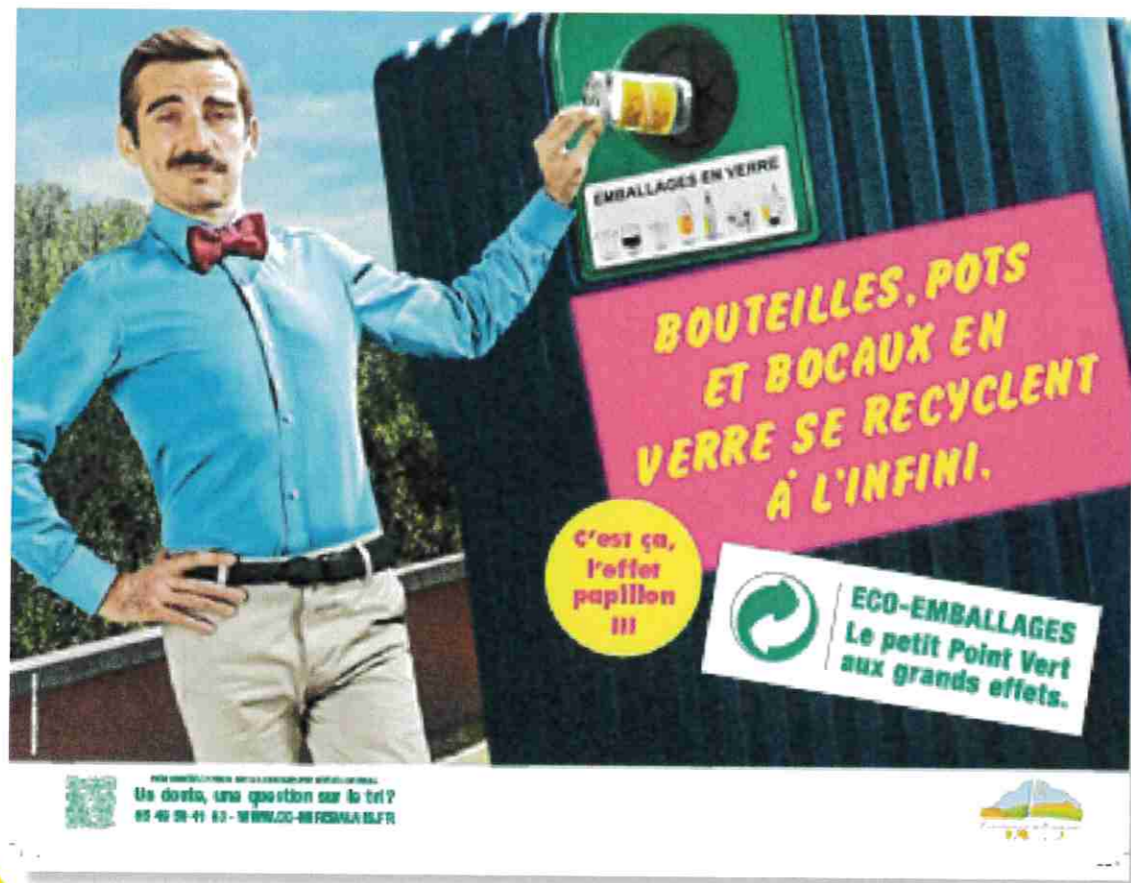
Coût dans une colonne de tri 40€ la tonne