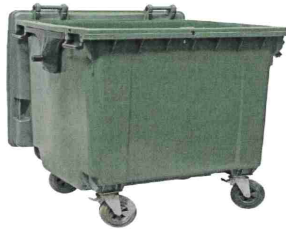
Coût dans une poubelle 171€ la tonne

et recyclée, plutôt que d'être jetée avec les ordures ménagères, permet de réaliser jusqu'à 130 € d'économie.