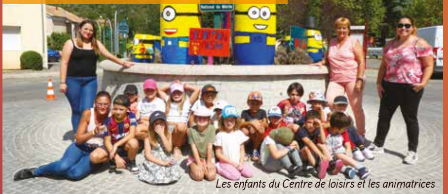
Les enfants du Centre de loisirs et les animatrices

Pour la rentrée des classes, le rond-point des écoles a été mis en valeur par une décoration conçue et fabriquée par les enfants du Centre de loisirs. Des Minions ont envahi l'îlot central pour encourager les enfants et les parents à reprendre le chemin de l'école. Cette action visait à sensibiliser les enfants à leur environnement et au recyclage des différents matériaux, tout en favorisant leur créativité.