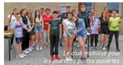
Le club mobilisé pour les journées portes ouvertes.

Les Journées portes ouvertes ont attiré beaucoup de monde. Au programme : animations, jeux avec l'association Turbuludo, visite du local, expo photo, et pour finir, un grand goûter.