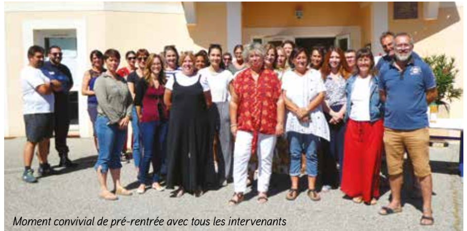
Moment convivial de pré-rentrée avec tous les intervenants