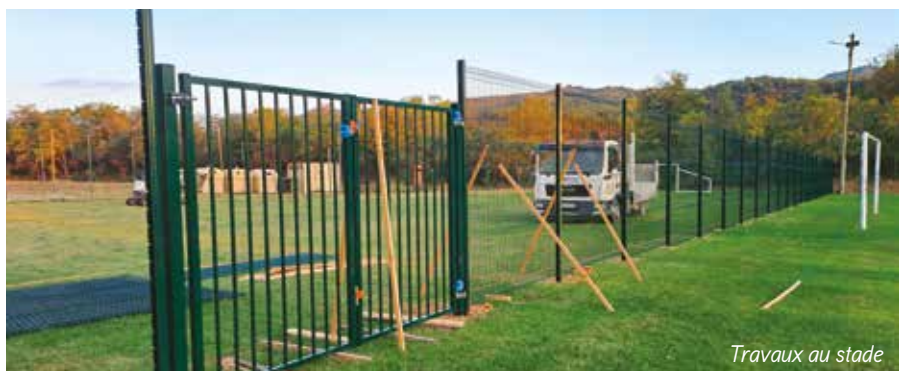
Travaux au stade

Nouveau projet concerté pour répondre à la demande de la jeunesse, le stade a été réaménagé. Un grillage et un portail ont été posés, créant ainsi un petit stade maintenant ouvert au public. Le grand stade, lui, reste réservé au club pour ses entraînements et ses matchs officiels avec un entretien spécifique. Nous comptons sur la responsabilité de chacun pour respecter ce nouvel espace.