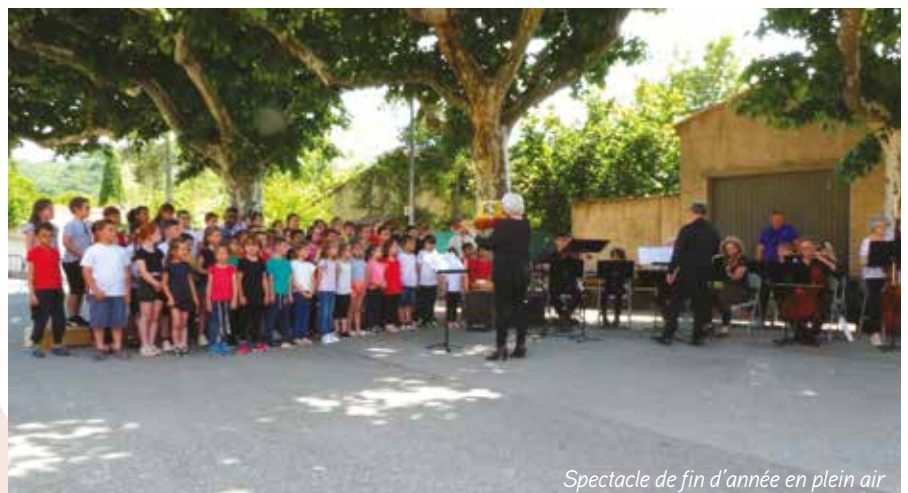
Spectacle de fin d'année en plein air

En juin dernier, nous avons assisté au très beau et touchant spectacle de fin d'année des élèves de l'école primaire de Malijai, préparé en collaboration avec les musiciens de l'École de musique de Saint-Auban. Une centaine de parents étaient présents. Cette année, la fête célébrait René Char, poète et résistant français.