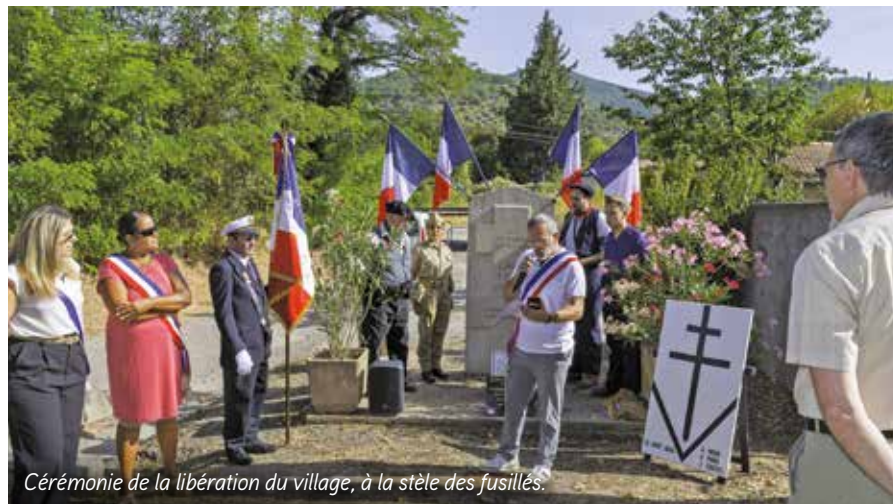
Cérémonie de la libération du village, à la stèle des fusillés.