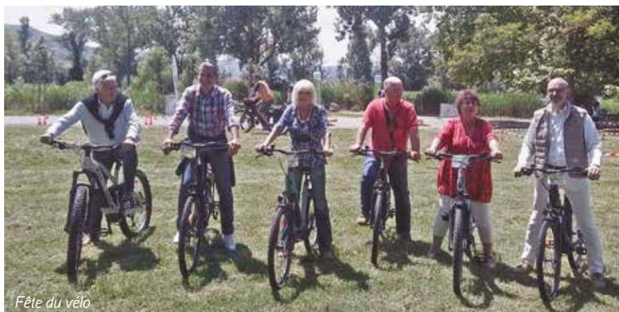
Fête du vélo

de route sur la route Malijai-col de Puimichel, un atelier de réparation, une bourse aux vélos, location de VTT à assistance électrique et une conférence/débat sur Ré-enchantons le vélo. Le public a répondu présent, faisant de cette manifestation une fête populaire.