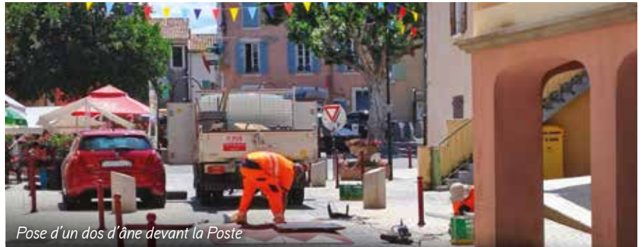
Pose d'un dos d'âne devant la Poste

La sécurisation de la commune se poursuit avec de nouveaux travaux qui ont été réalisés, à commencer par la pose de deux ralentisseurs devant le bureau de la Poste et devant l'entrée du stade et la reprise du virage au chemin de l'Olivette. Ces travaux ont été réalisés par l'entreprise Eiffage et ont bénéficié de subventions départementales (amendes de police).