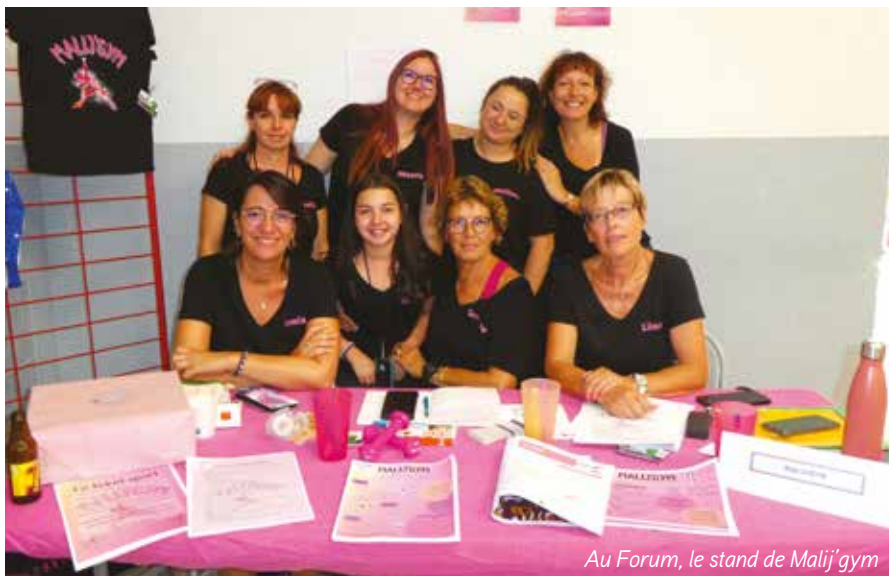
Au Forum, le stand de Malij'gym

proposées sur la commune. Chaque stand a exposé son offre afin de recruter de nouveaux adhérents. Merci à tous les bénévoles qui ont organisé cette belle journée.