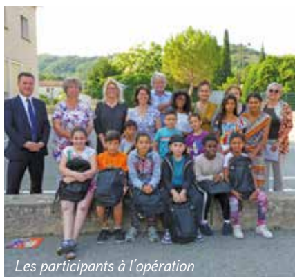
Les participants à l'opération

L'opération Mon sac de livres, belle initiative que l'on doit à Bibliothèques sans Frontières, a pour objectif de donner le goût de la lecture aux enfants exilés, tout en les aidant à découvrir leur nouveau pays d'accueil. C'est en présence de Monsieur le Directeur Académique des Services de l'Éducation nationale que, les jeunes élèves allophones ont reçu un sac à dos rempli de livres spécialement conçus et édités pour eux grâce à un travail pédagogique réalisé par les enseignants et leurs camarades. Parce que le livre est un vecteur du lien social, l'ensemble des élèves était concerné par l'évènement.