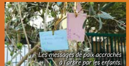
Les messages de paix accrochés à l'arbre par les enfants.

À l'occasion de la Journée mondiale de la paix, le 21 septembre, une animation de sensibilisation à la citoyenneté a été menée avec les élèves du CM2 dans le cadre du Projet Éducatif Territorial (PEdT). Au cours d'une cérémonie, un olivier, symbole de la paix, a été planté dans la cour de l'école et décoré de messages écrits et imaginés par les enfants avec l'aide de leur maitresse. L'évènement s'est terminé par un goûter. Notre PEdT est un véritable outil de concertation, de proximité et de développement dont les actions contribuent à l'épanouissement des enfants.