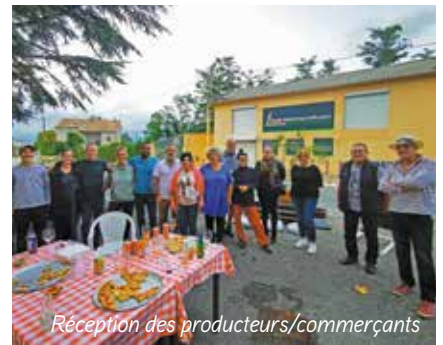
Réception des producteurs/commerçants

Le marché provençal hebdomadaire du jeudi, de 16 h à 19 h, est de plus en plus fréquenté par les Malijaiens. Chaque semaine, de nouveaux producteurs et commerçants viennent enrichir l'offre déjà existante : produits du terroir proposés par des producteurs maraîcher, fromager caprin, crémier affineur, mais aussi vêtements, pâtisseries, plats préparés provençaux ou réunionnais, parfums, savons, miels, etc.