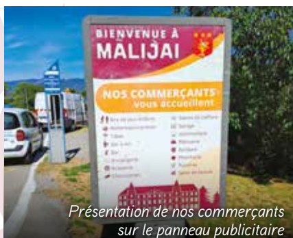
Présentation de nos commerçants sur le panneau publicitaire

Comme vous avez pu le constater, de nouvelles affiches destinées à renforcer l'attractivité de notre village ont été apposées dans les espaces publicitaires situés aux entrées de la commune. Elles sont l'aboutissement des rencontres de concertation avec les commerçants de Malijai.