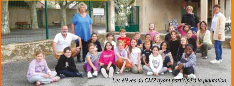
Les élèves du CM2 ayant participé à la plantation.

À l'occasion de la Journée mondiale de la paix, le 21 septembre, une animation de sensibilisation à la citoyenneté a été menée avec les élèves du CM2 dans le cadre du Projet Éducatif Territorial (PEdT). Au cours d'une cérémonie, un olivier, symbole de la paix, a été planté dans la cour de l'école et décoré de messages écrits et imaginés par les enfants avec l'aide de leur maitresse. L'évènement s'est terminé par un goûter. Notre PEdT est un véritable outil de concertation, de proximité et de développement dont les actions contribuent à l'épanouissement des enfants.