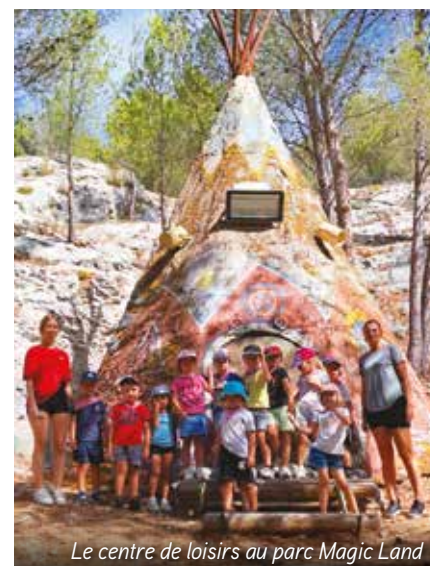
Le centre de loisirs au parc Magic Land

Nous vous donnons rendez-vous aux prochaines vacances de la Toussaint.