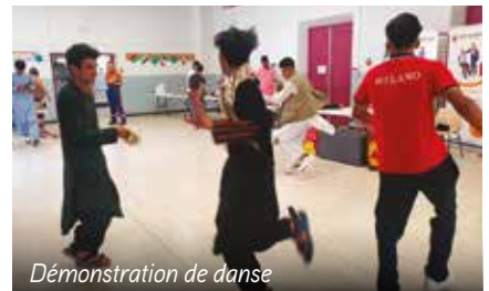
Démonstration de danse

civile et la présence des enfants des Chardons Bleus ont été particulièrement appréciées. Une belle journée d'échange.