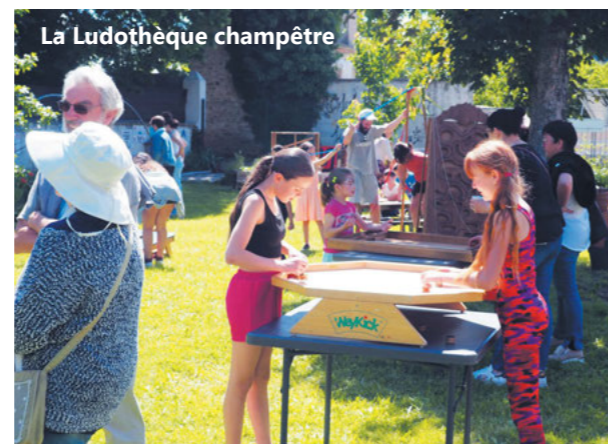
La Ludothèque champêtre