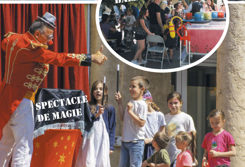
SPECTACLE DE MAGIE