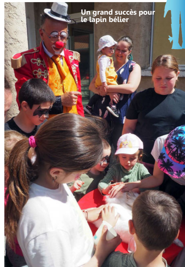
Un grand succès pour le lapin bélière

L'équipe du Centre de loisirs se structure et s'articule autour d'un Pôle Enfance Jeunesse qui compte une responsable coordinatrice et 6 animatrices et animateurs.