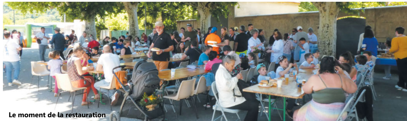
Le moment de la restauration

Célébrer le 20 e anniversaire, c'est célébrer un lieu emblématique où les enfants ont grandi, appris et partagé des moments inoubliables.