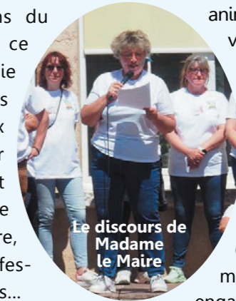
Le discours de Madame le Maire