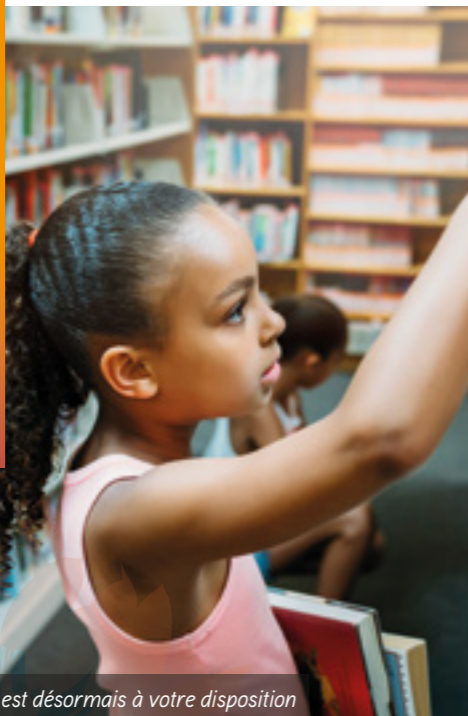
Un catalogue de 250 000 documents est désormais à votre disposition