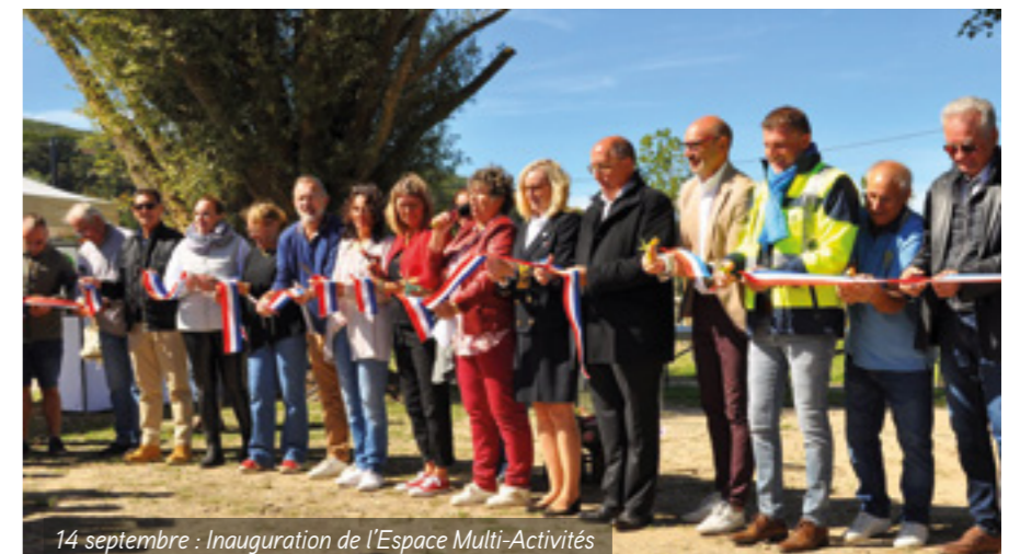
14 septembre : Inauguration de l'Espace Multi-Activités