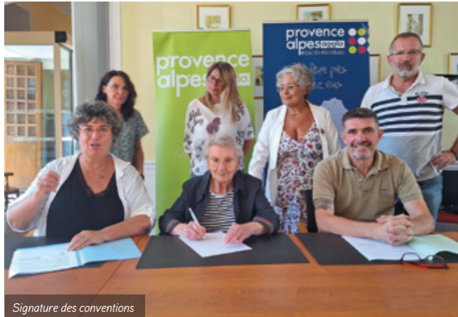
Signature des conventions

En plus des 4 500 titres du fond propre à l'association, un catalogue de 250 000 documents est désormais à votre disposition, à deux pas de chez vous. De plus, le service numérique de vidéos à la demande comprend plus de