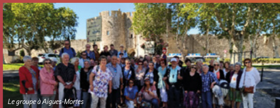
Le groupe à Aigues-Mortes

fameux chevaux de Camargue ne sont pas blancs dès leur naissance mais le deviennent par la suite. De retour sur la péniche, ils se sont régalés d'un déjeuner marin. Baignée de soleil, la journée s'est terminée par une visite de la ville des « eaux stagnantes » (Aigues Mortes en occitan). Merci à la vice-présidente du CCAS et à son équipe pour l'organisation de cette belle excursion.