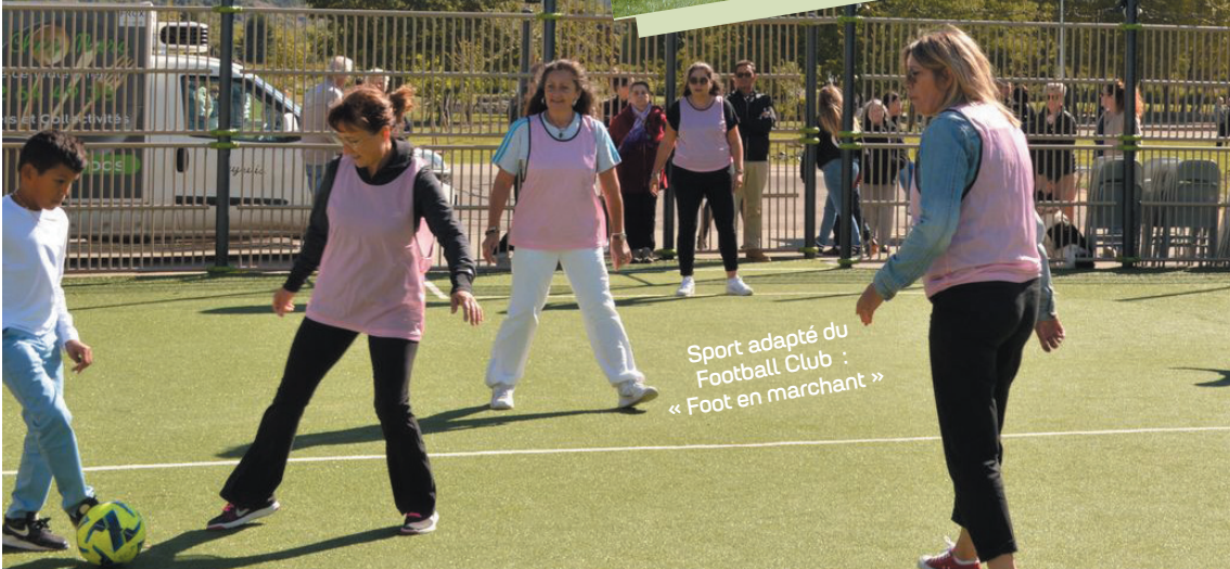
Sport adapté du Football Club : « Foot en marchant »