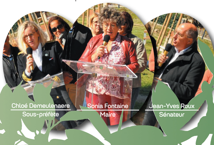
Chloé Demeulenaere Sous-préfète