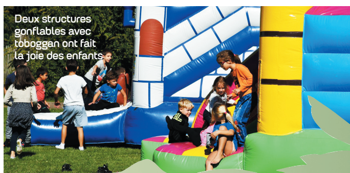
Deux structures gonflables avec toboggan ont fait la joie des enfants