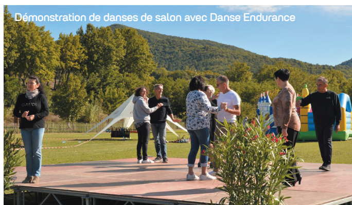
Démonstration de danses de salon avec Danse Endurance