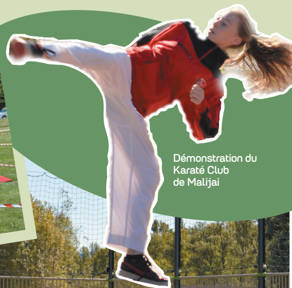
Démonstration du Karaté Club de Malijai