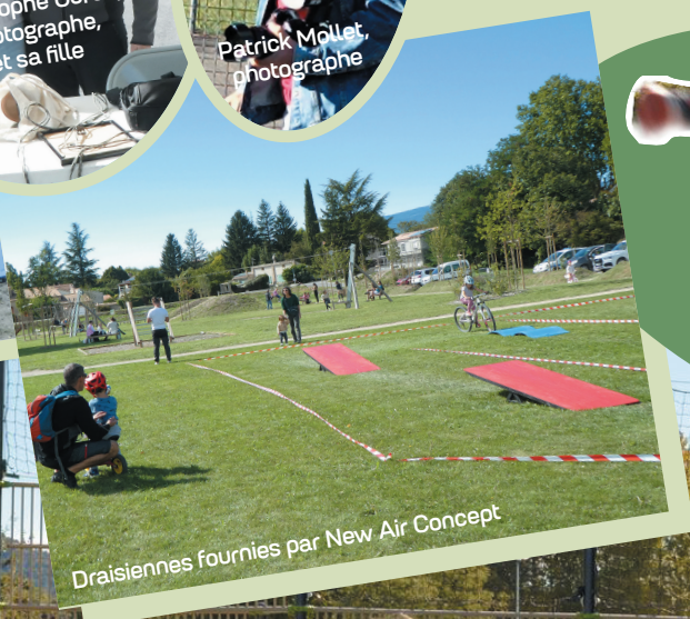
Draisiennes fournies par New Air Concept