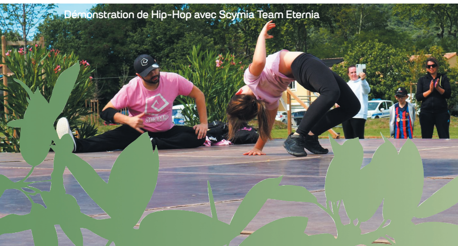
Démonstration de Hip-Hop avec Scymia Team Eternia