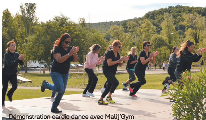
Démonstration cardio dance avec Malij'Gym