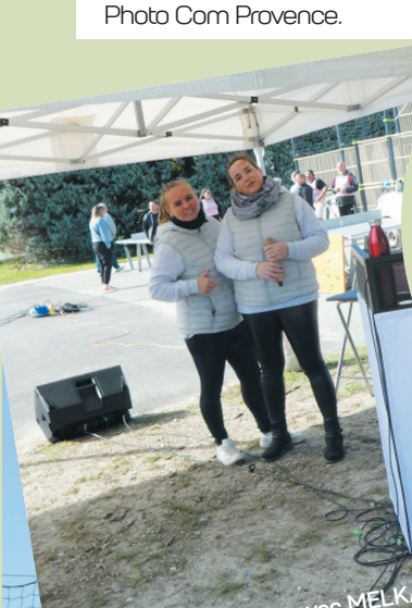
Animation et musique avec MELKA

Merci aux services techniques et administratifs de la mairie pour la préparation de cette journée d'inauguration. Merci aux associations participantes : Léa Lumés, Team Eternia, Football Club, Danse Endurance, Malij'Gym, Karaté Club, La Boule malijaienne, Tennis Club, ainsi qu'au groupe MELKA pour nous avoir accompagnés musicalement, et à New Air Concept pour les châteaux gonflables et les draisiennes.