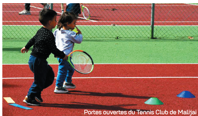
Portes ouvertes du Tennis Club de Malijai