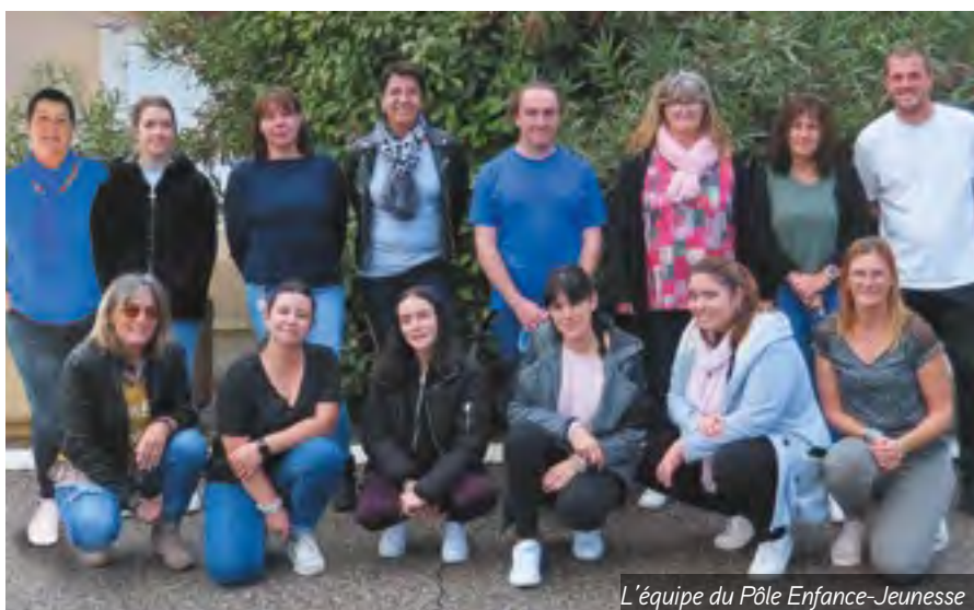
L'équipe du Pôle Enfance-Jeunesse