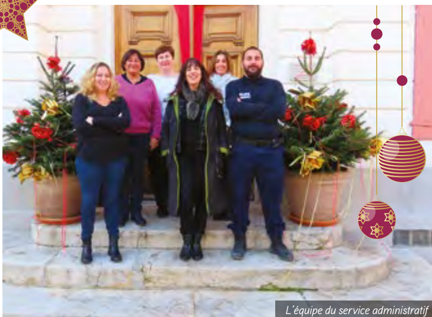
L'équipe du service administratif

Ce partenariat est un gage de réussite. Il repose sur la confiance, le respect mutuel et la volonté commune de servir l'intérêt général.