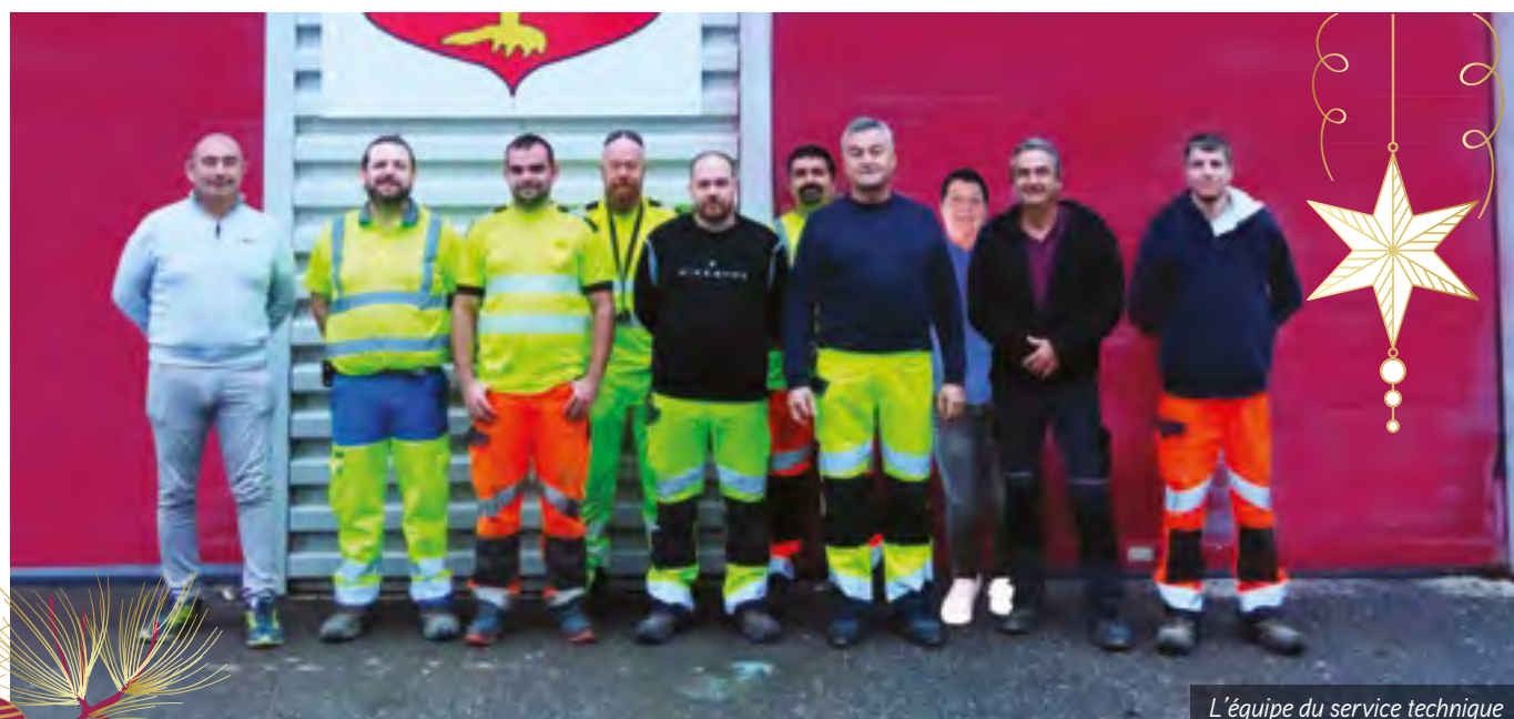
L'équipe du service technique